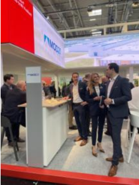
Foto 2 (MOD21 Team am Messestand)